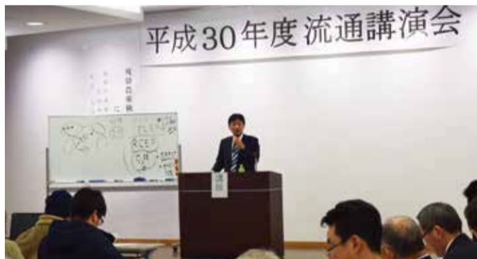
福岡市 園芸振興協会 主催流通講演会 (1月26日)