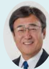
県議会議員 野原 たかし