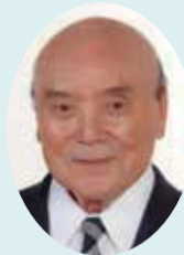
県議会議員 田中 久也