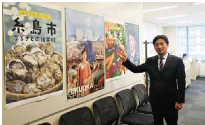
衆議院第2議員会館の執務室