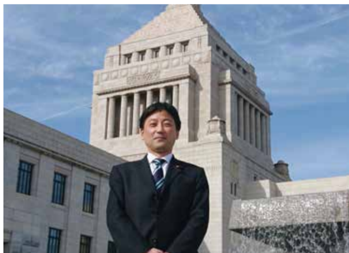
開会日に国会議事堂前にて

ご挨拶 おかげさまで7年目の議員活動に入りました。 平成から新元号に変わる節目の年、新時代においても我が国が持続的に発展していくためには、社会保障や子育て支援、各産業の振興、文教、エネルギー政策、さらには外交、安全保障など山積する課題を解決していく必要があります。 また、今年は12年に一度の、統一地方選挙と参議院議員選挙が行われる年でもあります。 各案件に対し、全力で取り組んでまいりますので、引き続き、皆様のご指導、ご支援の程宜しくお願い致します。