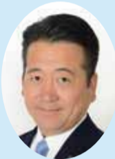
県議会議員 浦伊三夫