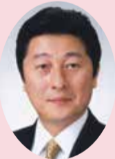
参議院議員 松山 まさじ

●前内閣府特命担当大臣 (二億総活躍等担当) ●現在 参議院政府開発援助(ODA)等に 関する特別委員長