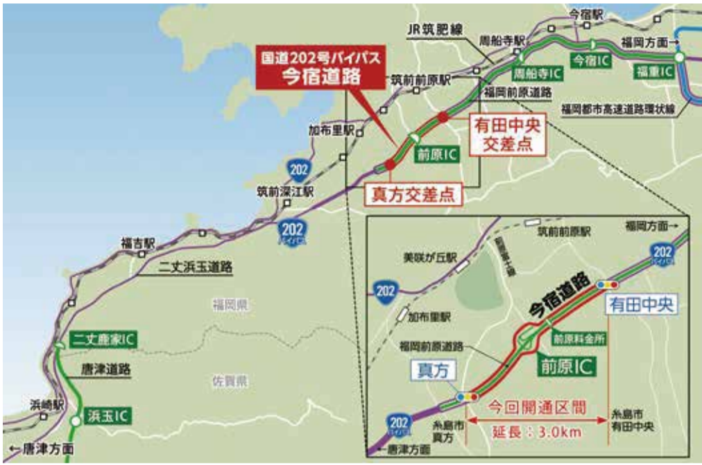
今宿道路 (国道202号バイパス) 有田中央交差点～ 真方交差点開通式 (1月27日)

昭和45年に着手された同事業の推進は太田誠一元衆議院議員から古賀議員に引き継がれ、平成最後の年に一区切りが付きましたが、今後は二丈鹿家に至る以西の西九州自動車道整備が課題となります。