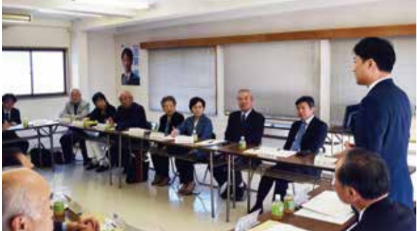
地元保護司等との意見交換会(11月24日)

また地元でも保護司や更生保護女性会、BBS等の方々への活動報告や意見交換を定期的に行いながら、安心、安全の地域作りに努めています。