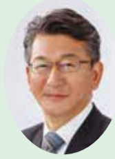
県議会議員 おおた 満