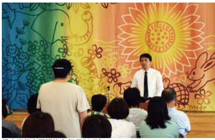
早良区保育園研修会(7月31日)

《古賀衆議院議員コメント》 待機児童解消のための園の整備だけでなく、園の質の充実が極めて大事です。園の先生方の処遇改善、人材確保策、公定価格の充実をはじめ、園の環境改善に努めてまいります。