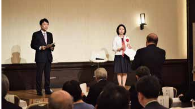
自見はなこ参議院議員を迎えての篤医会講演会(7月7日)

《古賀衆議院議員コメント》 政府与党では、今後3年間で社会保障改革を断行するとしており、待ったなしの課題です。 世界でも高齢化社会の先頭をいく日本が、社会保障分野の取組において世界の先行モデルとなるよう、改革を推進してまいります。