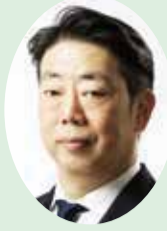
市議会議員 津田 信太郎