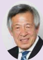
県議会議員 武藤 英治