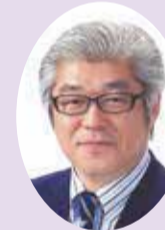
市議会議員 阿部 真之助