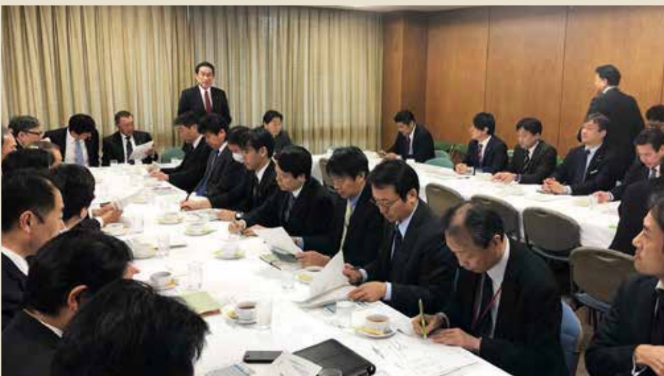
経済成長戦略本部

今年1月に戦略本部の下に5つのプロジェクトチームが設置され、その一つである「格差の少ない「人」が主役の社会づくりPT」の主査として、社会保障や雇用、賃上げ等の議論をリードしています。